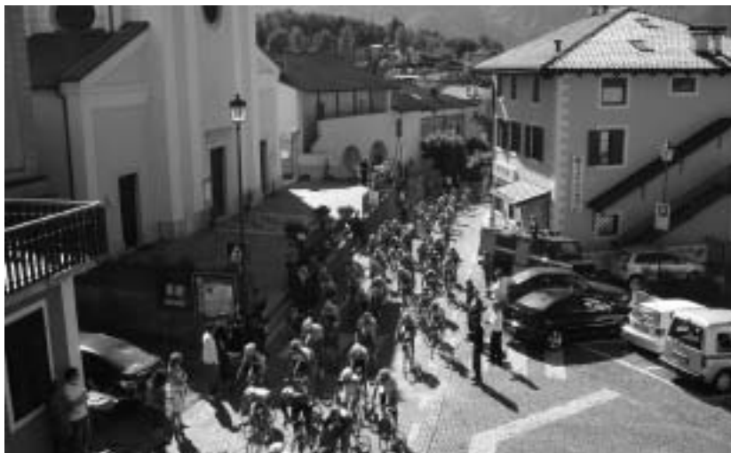
Dal 2007 la Coppa d'Oro passa per le vie del centro di Tenna