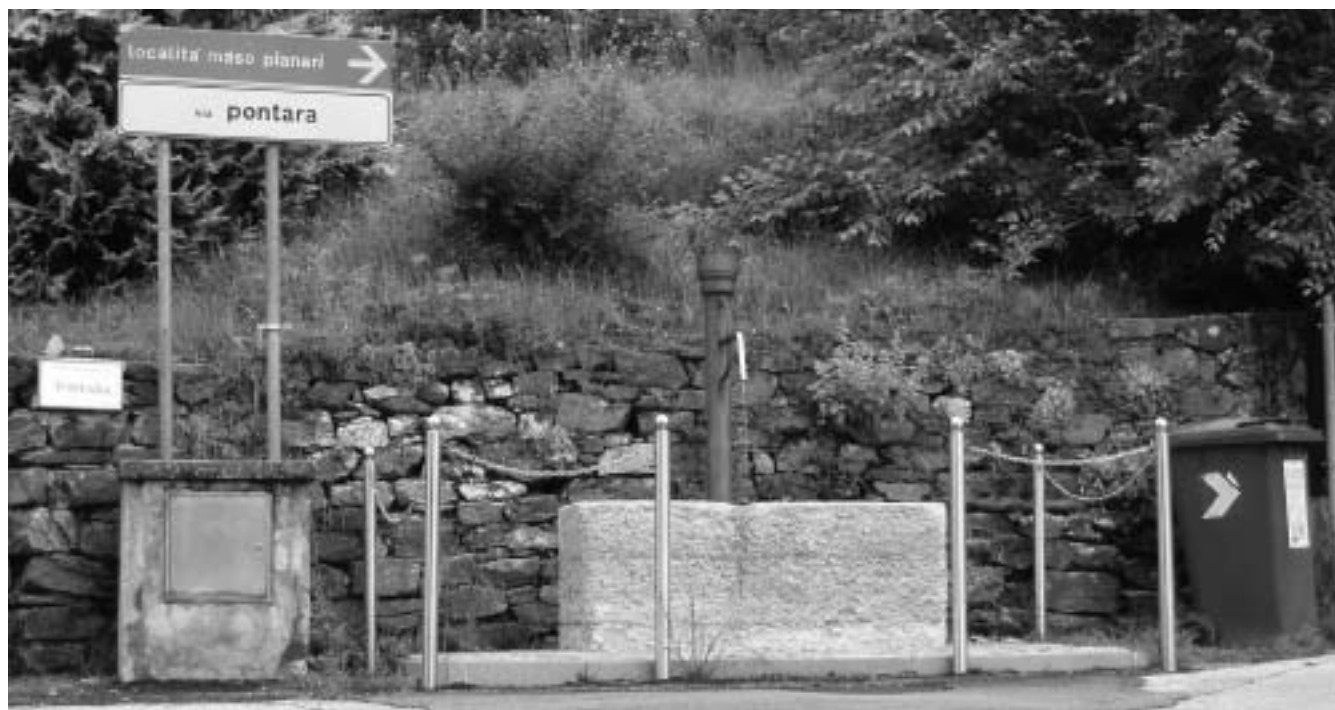
L'incrocio di via Pontara

nato. In quel periodo, interessato da forti precipitazioni, i rigonfiamenti presenti nei muri in questione erano peggiorati, inducendo il sindaco a chiudere la strada per una questione di sicurezza. È stato pertanto chiesto un sopralluogo da parte del servizio Calamità Pubbliche della PAT che ha attribuito il problema ad una cattiva manutenzione prolungata nel corso di questi 40-50 anni e non ad una calamità pubblica, escludendo di fatto un sostegno finanziario, ma confermando l'opportunità di tenere chiusa la strada. Per esserne certi abbiamo richiesto anche l'intervento di un ingegnere esperto in materia, il quale ci ha evidenziato lo stato di pericolo in cui versavano anche i muri a valle della strada. Quale sindaco se la sarebbe sentita di tenere la strada aperta?