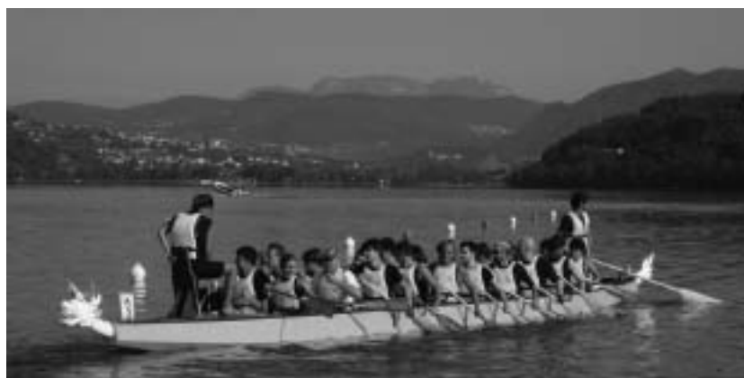
Il Dragon Tenna sulla nuova imbarcazione

Complessivamente ci riteniamo soddisfatti della stagione soprattutto perchè siamo riusciti a raggiungere il nostro obiettivo di partecipare a tutte le gare, ottenendo dei buoni risultati, e riuscendo a inserire nel gruppo alcuni giovani elementi del paese.