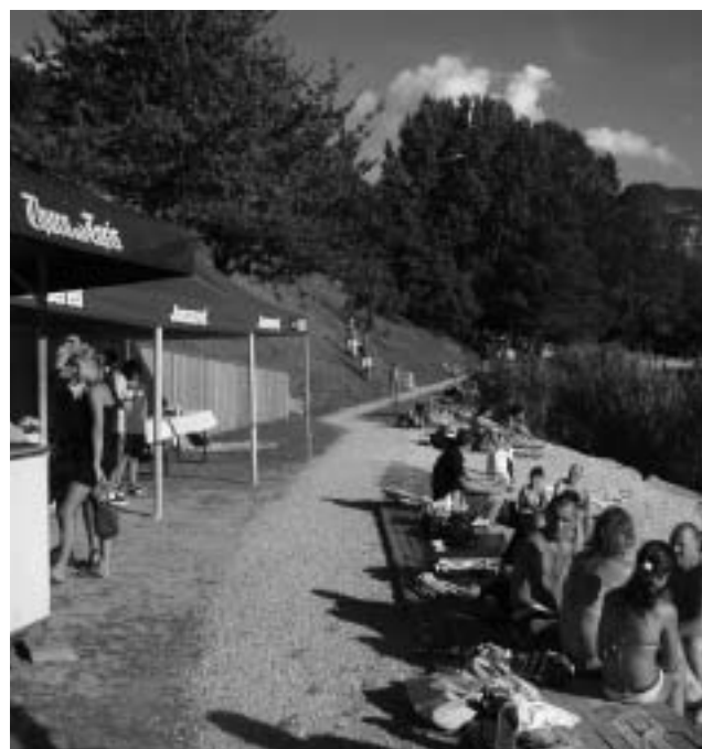
La Spiaggia di Tenna