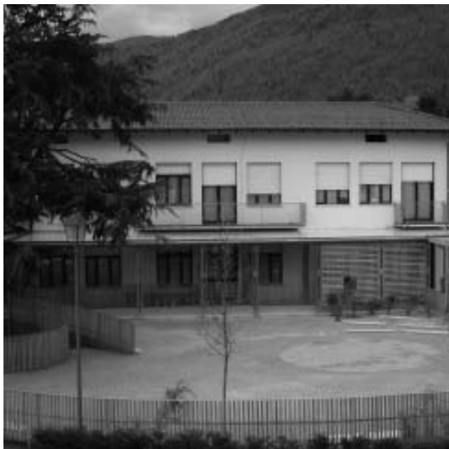
Il nuovo piazzale delle scuole