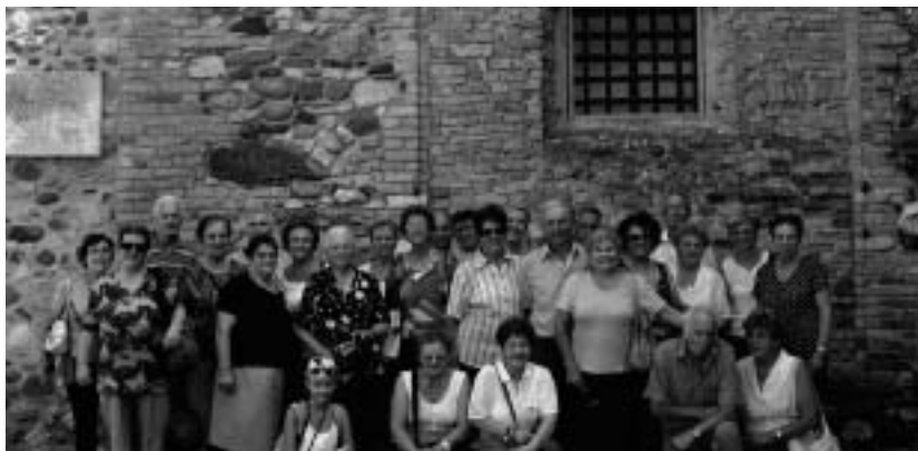
Alla Rocca di Solferino