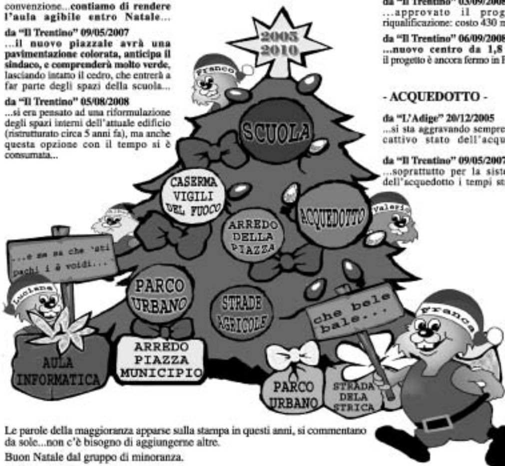
Le parole della maggioranza apparse sulla stampa in questi anni, si commentano da sole...non c'è bisogno di aggiungerne altre. Buon Natale dal gruppo di minoranza.