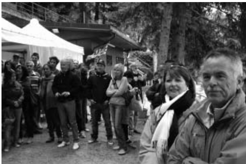
Un momento delle celebrazioni