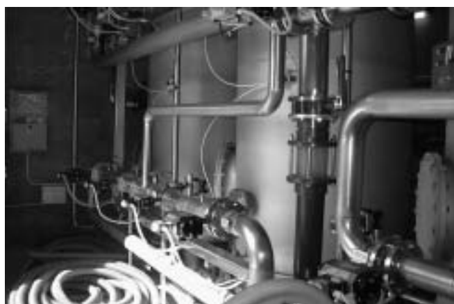
In partenza i lavori sulla rete acquedottistica

Approvazione convenzione per la gestione e/o supporto in tema di procedure di affidamento di appalti pubblici (nr. 21 del 08/10/2009). Dal 1° maggio 2009 è attiva l'Agenzia per i servizi, il cui scopo è quello di fornire consulenza e/o assistenza alle amministrazioni in materia di appalti di lavori, di servizi e di forniture con particolare riferimento alle procedure di scelta del