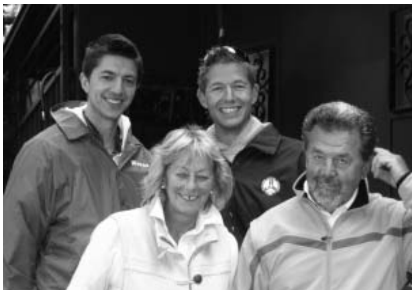
La famiglia Degasperi al completo

Tra le sue "mani" sono passati atleti di gran calibro, che negli anni sono diventati delle vere e proprie stelle dello sci nautico: nell'ordine ci riferiamo