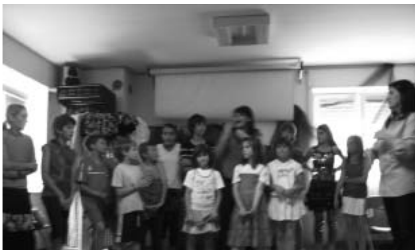
I ragazzi del "Mercoledì Libero"