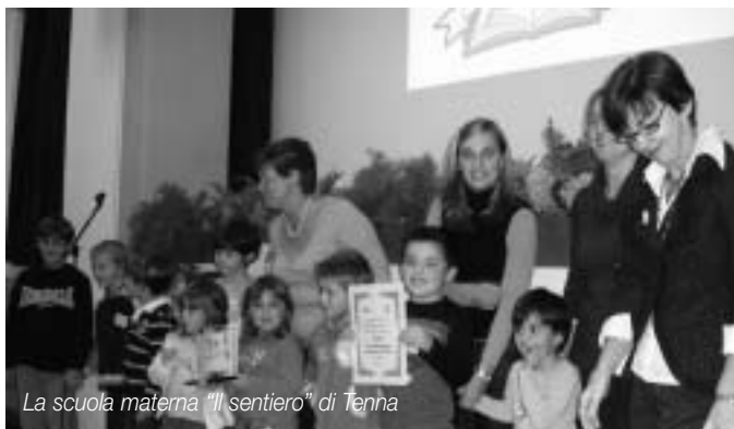
La scuola materna "Il sentiero" di Tenna