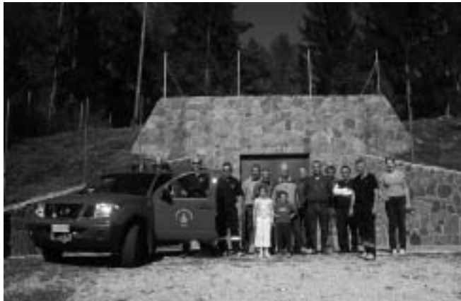
Contributo straordinario ai pompieri

Con deliberazione di data 13.4.2007 la giunta provinciale ha ammesso a finanziamento l'intervento in questione, riconoscendo un contributo pari a € 472.048,00 finanziato per € 354.036,00 in conto capitale e per € 118.012,00 in conto annualità.