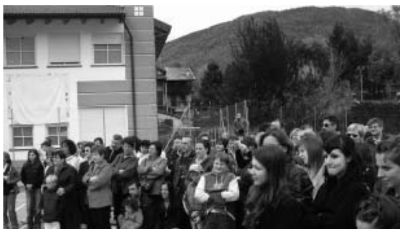
Un momento dell'inaugurazione