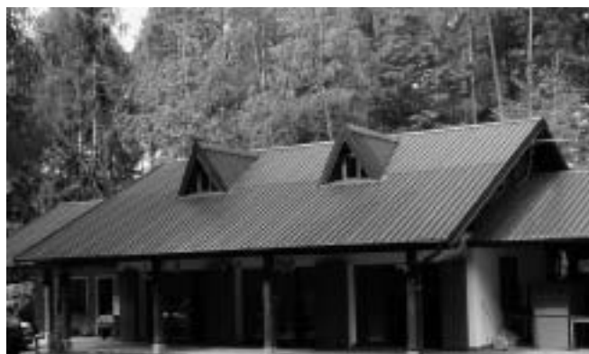
La baita degli alpini

Accordo di programma tra i Comuni di Calceranica al Lago, Caldonazzo, Levico Terme, Pergine Valsugana