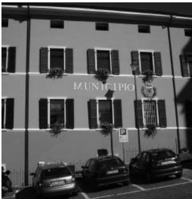
Il municipio di Tenna ritinteggiato

quando piccoli “problemini” prontamente risolti. Importante è stato anche la stesura del nuovo regolamento comunale relativo all’acquedotto, dove un punto importante dello stesso porta la tubazione di proprietà comunale fino al contatore e non più solo sulla condotta principale. Intervento senza dubbio importante è stato quello del passaggio della gestione totale alla STET di Pergine Valsugana. Gestire l’acquedotto con le nostre forze era diventato impossibile. Come promesso dalla PAT, quei Comuni che si avessero dato da fare nel campo del risparmio di acqua potabile sarebbero stati premiati con nuovi finanziamenti, cosa che si è verificata per Tenna con un finanziamento per ulteriori lavori all’acquedotto che partiranno il prossimo anno.