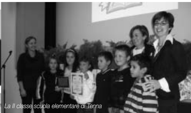
La II classe scuola elementare di Tenna