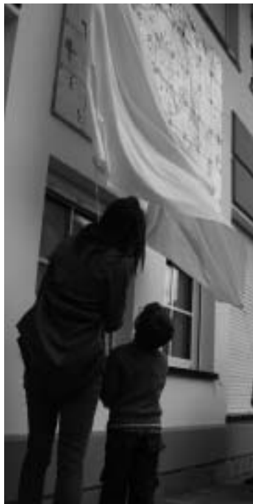
Viene tolto il velo dall'opera del "Vittoria"

I bambini e le bambine che frequentano la scuola dell'infanzia "Il sentiero" sono 32, di cui 13 maschi e 19 femmine. L'organico della scuola è costituito da cinque insegnanti, un cuoco e due ausiliarie.