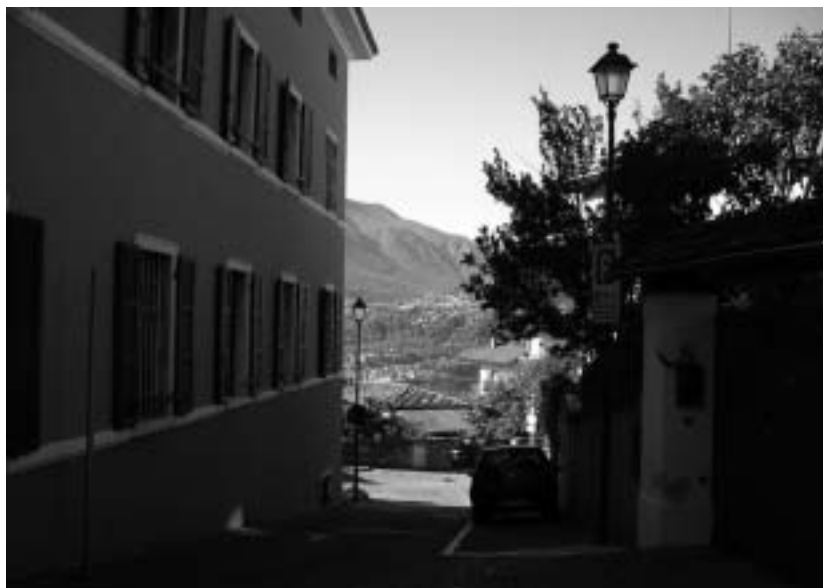
Il nuovo impianto nella via restrostante il municipio