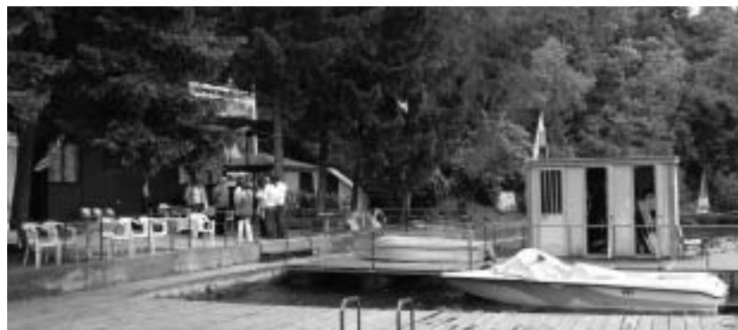
Il centro nautico