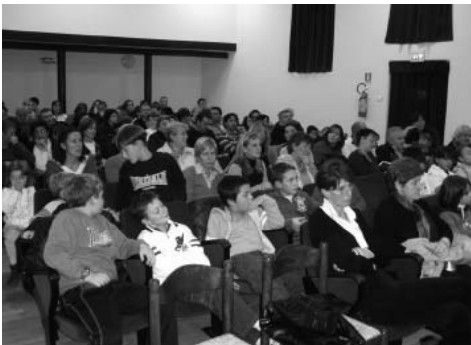
Il pubblico presente al concorso

Auguriamo a tutti un buon Natale ed un sereno e felice 2010.