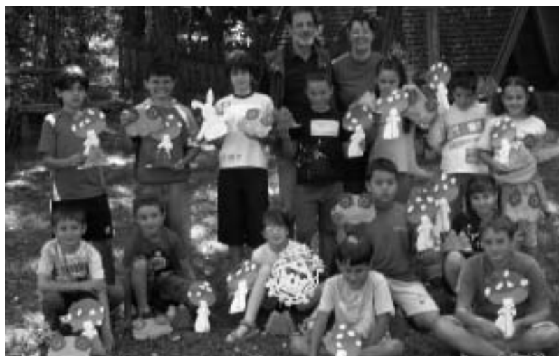
I partecipanti al corso di "traforo"

Abbiamo chiuso l'estate con la classica festa di fine estate presso la baita degli alpini. E' stata una giornata favorita dal sole ma soprattutto dalla presenza di tantissimi ragazzi e genitori (circa 180). Certamente un riconoscimento finale per chi crede in queste iniziative. Chiuso estate ragazzi ci si è subito immersi nelle attività programmate per l'autunno - inverno.