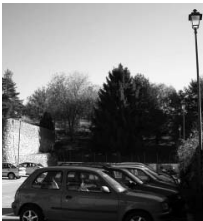
I punti luce installati nel parcheggio dell'Oratorio