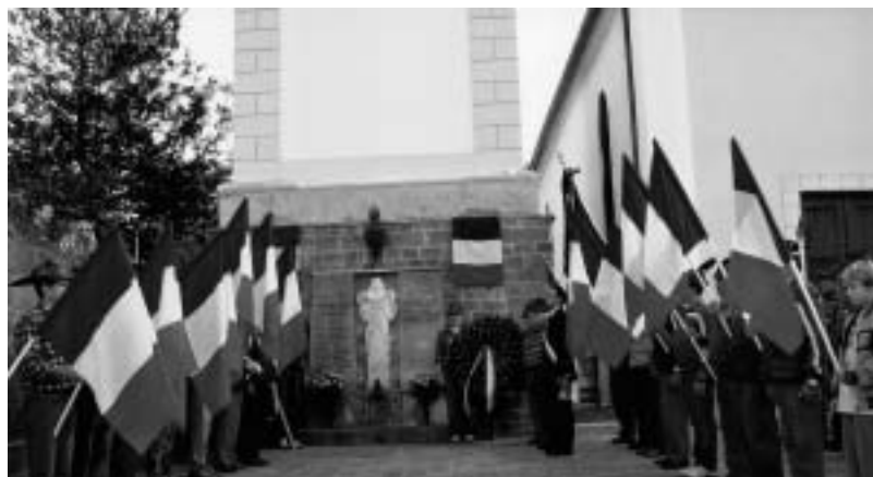
Davanti al monumento ai caduti