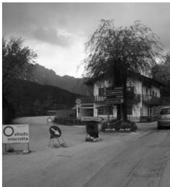
La strada della "Strica" ancora chiusa