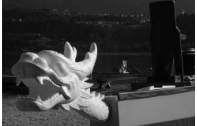
Acquistata la nuova barca di dragon boat