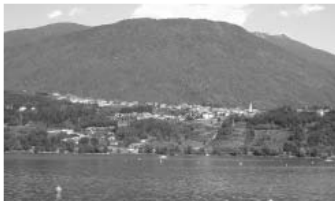
Tornerà la vite sul colle di Tenna

Accordo di programma tra i Comuni di Calceranica al Lago, Caldonazzo, Levico Terme, Pergine Valsugana e Tenna per lo sviluppo e la riqualificazione del territorio. Approvazione progetto preliminare avente oggetto "Riqualificazione delle aree agricole della collina di Tenna e del Colle delle Benne" (nr. 18 del 28/07/09). Nell'ambito dell'Accordo di Programma per lo sviluppo e la riqualificazione del territorio dei Comuni di Calceranica al Lago, Caldonazzo, Levico Terme, Pergine Valsugana, Tenna", sottoscritto in data 22 gennaio 2007, è stato predisposto il progetto preliminare relativo alla "Riqualificazione delle aree agricole della collina di Tenna e del Colle delle Benne". In particolare il progetto prevede una spesa complessiva di € 4.740.880,71 ed in base alle modalità di ripartizione della spesa stabilite in sede di Accordo di Programma la quota parte di finanziamento di competenza di ciascun Comune risulta: