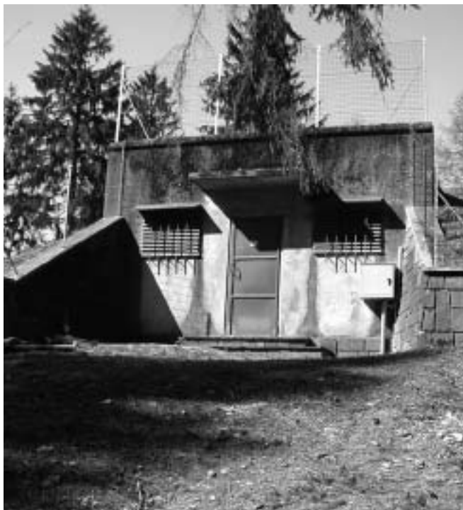
Il vecchio acquedotto di Tenna

quando piccoli “problemini” prontamente risolti. Importante è stato anche la stesura del nuovo regolamento comunale relativo all’acquedotto, dove un punto importante dello stesso porta la tubazione di proprietà comunale fino al contatore e non più solo sulla condotta principale. Intervento senza dubbio importante è stato quello del passaggio della gestione totale alla STET di Pergine Valsugana. Gestire l’acquedotto con le nostre forze era diventato impossibile. Come promesso dalla PAT, quei Comuni che si avessero dato da fare nel campo del risparmio di acqua potabile sarebbero stati premiati con nuovi finanziamenti, cosa che si è verificata per Tenna con un finanziamento per ulteriori lavori all’acquedotto che partiranno il prossimo anno.