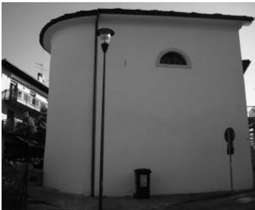
L'illuminazione nei pressi della cappella