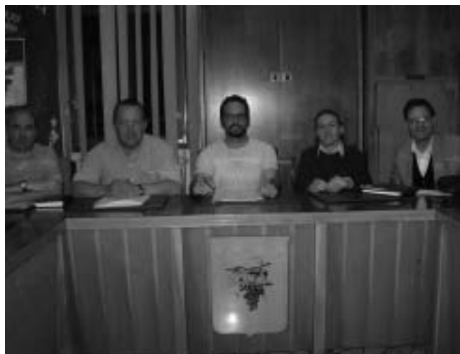
La giunta comunale uscente

Importante traguardo è stato ottenuto certificando l'amministrazione secondo i criteri EMAS, assieme ai comuni limitrofi, applicati alle procedure interne in campo ambientale.