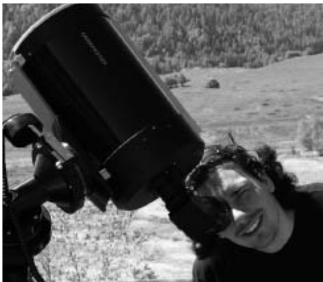
Christian Lavarian del Museo Tridentino