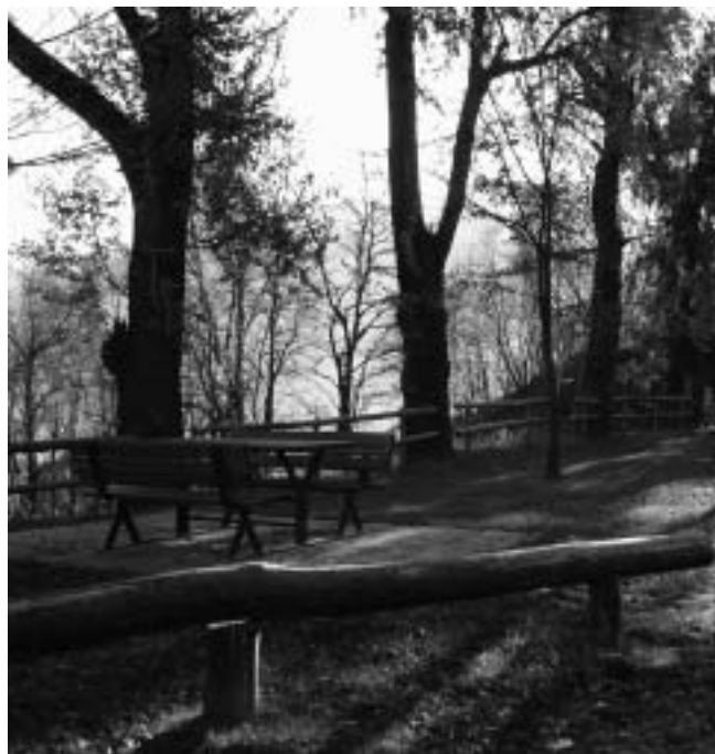
L'area sistemata all'entrata di Tenna

A maggio del prossimo anno, lasceremo in eredità ai futuri amministratori una bella serie di lavori, e spero che prevalga la logica del “bene comune”. Ricordo il progetto per la sopraelevazione della nostra scuola; ricordo il progetto (già finanziato) della ristrutturazione dell'edificio comunale; ricordo il progetto (già finanziato) dell'acquedotto comunale; ricordo il progetto di riqualificazione del nostro parco urbano (in parte a carico del servizio valorizzazione ambientale della PAT); ricordo il progetto per riqualificare quella zona nella pineta di Alberé compresa fra il nuovo parcheggio della “Codoma” e l'aerea “casa degli Alpini” dove si spera di poter realizzare una discarica inerti per concludere con nuovi spazi