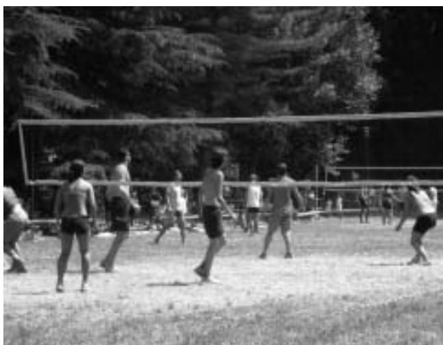
Green Volley in Alberé