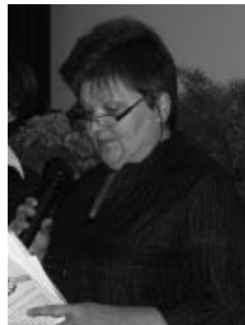
La presidente Bressan

Il tema della quarta edizione, vuole dar risalto alle diverse bellezze paesaggistiche, naturalistiche, storiche, culturali del territorio che ci circonda comunicandole attraverso la fotografia, il disegno, la pittura ma anche attraverso la scrittura dei propri sentimenti. Il bando di concorso uscirà verso fine anno e coinvolgerà, come di consueto, adulti e ragazzi. Speriamo di cogliere altrettante adesioni ma soprattutto l'entusiasmo e la partecipazione dei tenaroti