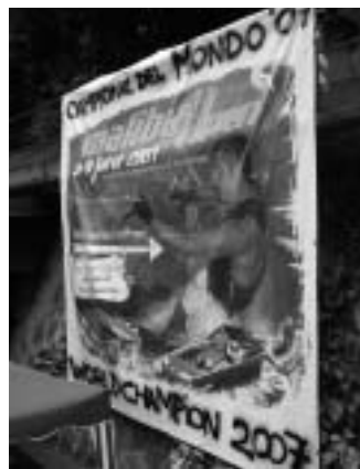
Il cartellone dedicato a Thomas Degasperi