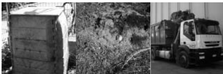
composter domestico €/ton. 0

Serve esclusivamente per le piccole quantità di ramoscelli o erba. La chiave per la loro apertura sarà riti-