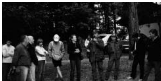
L'inaugurazione del sentiero degli Gnomi

Il progetto viene approvato all'unanimità.