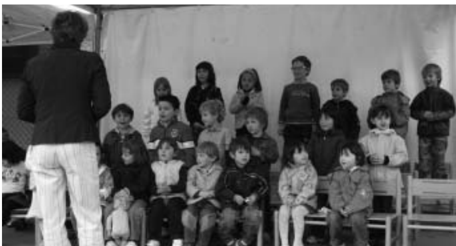
I bambini della scuola cantano