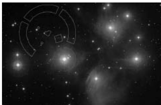
Ammirare le stelle