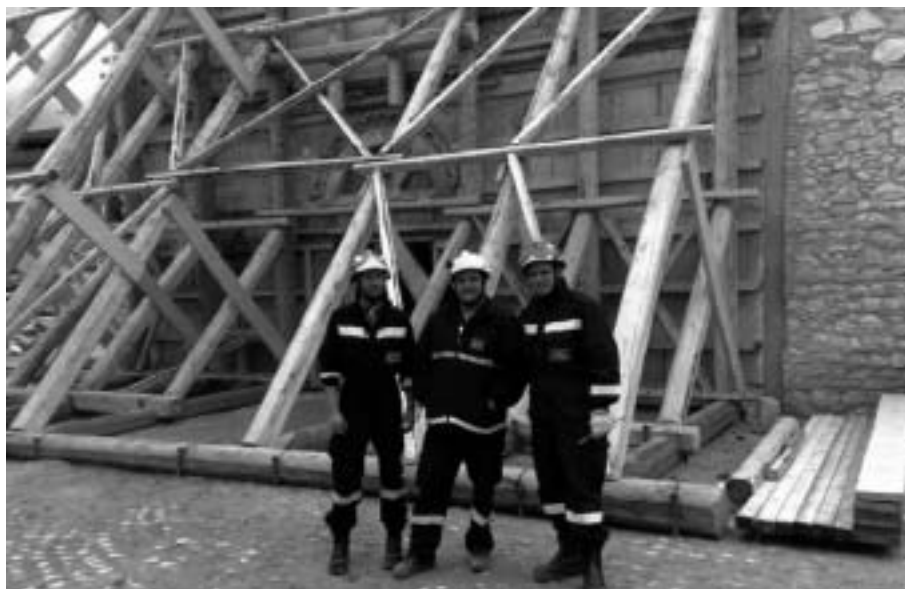
I nostri pompieri davanti alla chiesa di Onna

“Un periodo intenso di lavoro che ci ha fatto condividere il grande senso