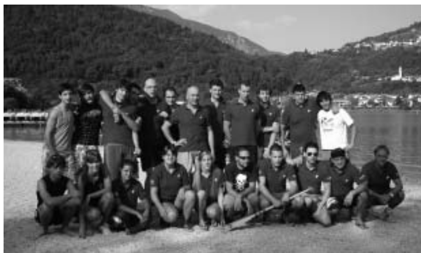
La squadra del Dragon Boat Tenna

Il terzo appuntamento del campionato trentino di Dragon Boat si è svolto domenica 2 agosto presso il Lago di Santa Giustina in val di Non per una gara sulla distanza di 9 km, la Dragononesa. Anche qui si trattava della nostra prima partecipazione a questa