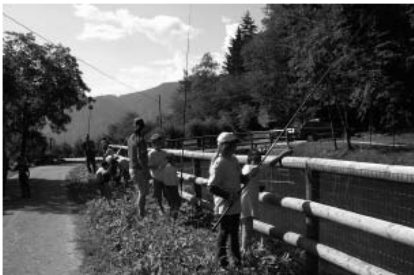
I ragazzi a pesca

Un'estate insieme per fare amicizia, divertirsi, scoprire, imparare, giocare e... diventare grandi! Questo slogan racchiude in sé il contenuto e le finalità delle iniziative che l'associazione, Tennattiva assieme ad altri attori del volontariato, attua nel corso dell'estate. Sembra di essere ripetitivi nel riprendere e raccontare alla fine di ogni anno, le varie tappe che hanno caratterizzato l'estate dei bambini e non solo, ma riteniamo corretto ripercorrerle come segno di ringraziamento per tutti coloro, che a vario titolo, hanno collaborato con noi per dare significato alle parole scritte in precedenza: amicizia, divertimento, gioco apprendimento e responsabilità.