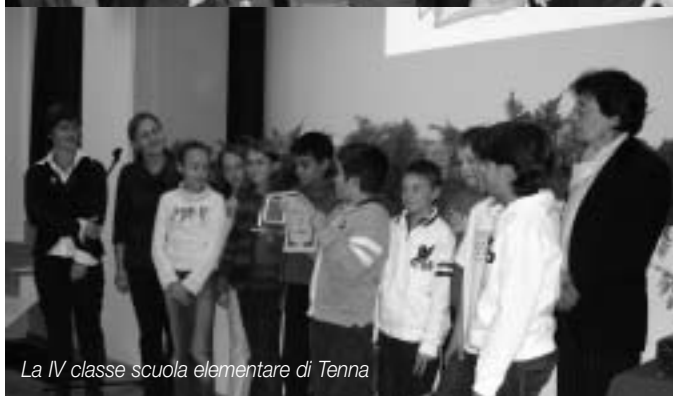
La IV classe scuola elementare di Tenna